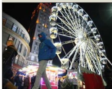
La grande roue s'installera bien rue de Noyon.

Alors que lundi soir, la ville adressait un ultimatum aux exploitants de la grande roue et annonçait qu'elle ne viendrait pas sur le marché de Noël d'Amiens, changement de cap. On apprenait hier, mardi matin, que la grande roue était autorisée à venir, rue de Noyon (près de la gare). Les exploitants paieront les droits du sol et n'installeront pas leurs propres chalets de vente. L'installation doit débiter aujourd'hui et le marché de Noël ouvre vendredi soir. C'est une déception toutefois pour les forains, dont l'activité seule de la roue, n'assure pas assez de revenus, selon eux.